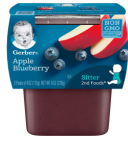
Tufaha na Blueberry