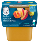
Aprikoti Mchanganyiko wa Matunda