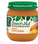
Mahindi Kiazi Tamu