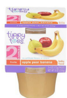
Tufaha Pea Ndizi