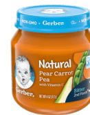
Pea Karoti Pea