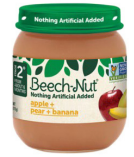
Tufaha Pea Ndizi