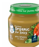
Tufaha Mchicha Sukuma Wiki