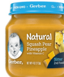
Mung'unye Pea Nanasi