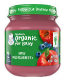
Tufaha Beri za Samawati Mwit

Gerber® 2nd Foods® Vya Kikaboni; Vyombo vya glasi vya aushi 4 pekee. Aina maalum tu kama zilizoorodheshwa hapa chini: