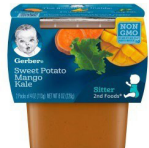
Kiazi Tamu Embe Sukuma Wiki