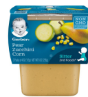
Pea Boga Dogo Mahindi