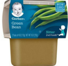
Maharagwe ya Kijani