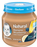
Ndizi Beri za Samawati