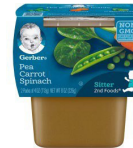
Pea Karoti Mchicha