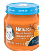
Viazi Vitamu Ndizi Chungwa