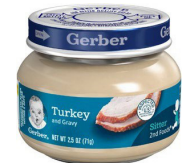
Bata Mzinga & Rojo