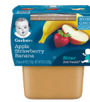
Tufaha Stroberi Ndizi