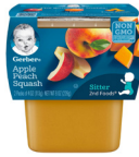
Tufaha Pichi Mung'unye