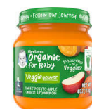
Viazis Vitamu Tufaha Karoti Mdalasini