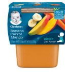
Ndizi Karoti Embe