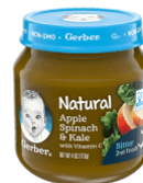
Tufaha Mchicha Sukuma Wiki