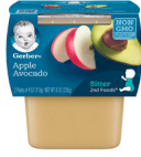
Tufaha na Parachichi