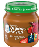
Tufaha Stroberi Viazisukari