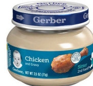
Kuku & Rojo