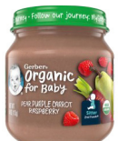
Pea Karoti ya Zambarau Rasiberi