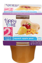
Mung'unye Tufaha Pea