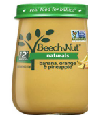
Ndizi Chungwa Nanasi