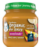
Embe Tufaha Ndizi