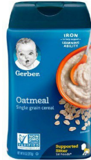
Mlo wa shayiri