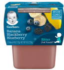
Ndizi Beri Nyeusi Beri za Samawati