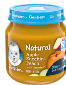
Tufaha Boga dogo Pichi