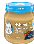
Tufaha Stroberi Ndizi