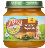
Mung'unye ya Msimu wa Baridi