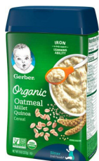
Mlo wa shayiri