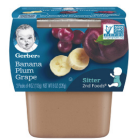
Ndizi Plamu Zabibu