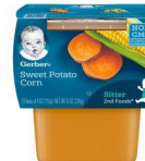
Kiazi Tamu Mahindi