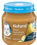
Pea Boga dogo