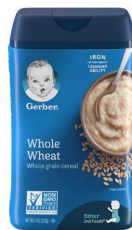
Ngano Yenye Lishe Kamili