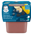
Fig Mi Dat Mitiy