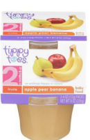
pòm pwa Fig Mi