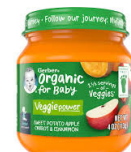
Patat Pòm Kawòt Kannèl