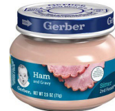
Janbon ak sòs