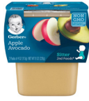
Pòm ak Zaboka