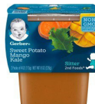
Patat Dous Mango Kale