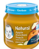
Pòm Zoukini ak Pèch