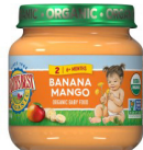
Fig Mi Mango