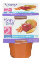
Pòm kawòt mango