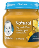
Joumou Pwa ak Anana