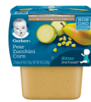
Pwa Koujèt Mayi