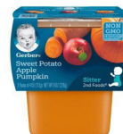
Pòm detè Pòm Joumou