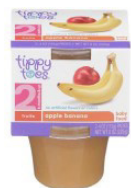
Pòm ak Fig Mi