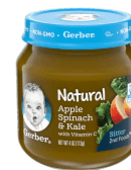
Pòm Epina ak Chou Frize