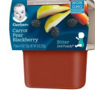
Kawòt Pwa Blackberry