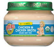
Poul ak Poul Bouyon

Pou patisipan k ap bay tete sèlman mak Pi Bon Byo Tè a sèlman; Bokal 2.5 ons an kristal sèlman; Sèlman kategori espesifik jan yo enimerè anba: