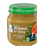
Pòm Epina Chou Frize