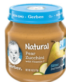
Fui Pwa ak Zucchini