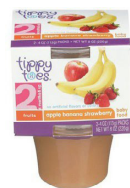
Pòm ak Fig Mi Frèz