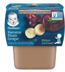
Fig Mi Prin ak Rezen