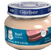
Vyann bèf ak sòs

Pou patisipan k ap bay tete sèlman; Mak Gerber sèlman antanke manje konplèmantè; Bokal 2.5 ons an kristal sèlman; Sèlman kategori espesifik jan yo enimerè anba: