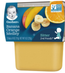
Fig Mi Zoranj Medley