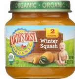
Joumou sezon Ivè