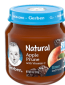
Pòm Prin seche