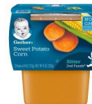
Patat Dous Mayi