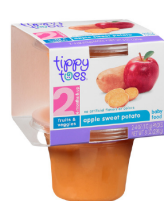
pòm dous pòm detè