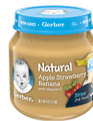
Pòm Frèz Fig Mi