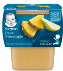
Fui Pwa ak Anana