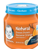
Patat Dous Fig Mi Zoranj