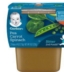
Pwa Kawòt Epina