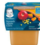
Pòm kalbas Mayi