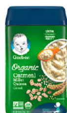
Farin avwàn Millet Quinoa