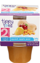
Joumou Pòm Pwa