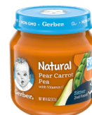
Pwa Kawòt Pwa