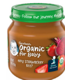
Pòm Frèz Bètrav