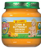
Mayi Nwa ak Joumou