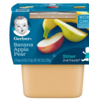
Fig Mi Pòm ak Pwa