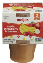
Pòm Frèz Fig Mi

Manje ki gen mak Meijer sèlman; Pakè double 2-4 ons an plastik; Sèlman kategori espesifik yo enimerè yo: