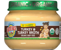
Kodenn ak Kodenn Bouyon