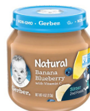
Fig Mi Mitiy