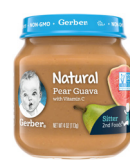
Pwa ak Gwayav