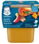
Pòm Pèch Joumou