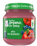
Pòm Sovaj Mitiy

Gerber® 2yèm Aliman® Byolojik; Resipyan an kristal 4 ons sèlman. Sèlman kategori espesifik jan yo enimerè anba: