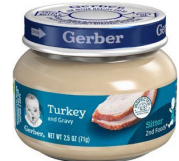
Kodenn ak Sòs