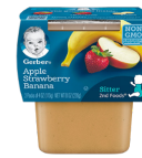
Pòm Frèz ak Fig Mi