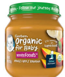
Mango Pòm Fig Mi