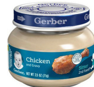
Poul ak sòs