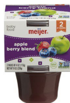
Pòm ak Bè Melanj