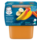
Fig Mi Kawòt Mango