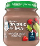
Pwa, Kawòt Mov Franbwaz